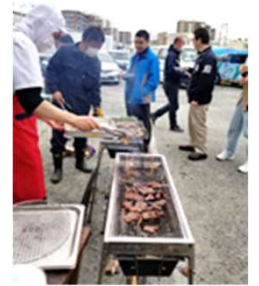
BBQ！ 食材の準備・設営・片付けまで 全員で取り組みました♪