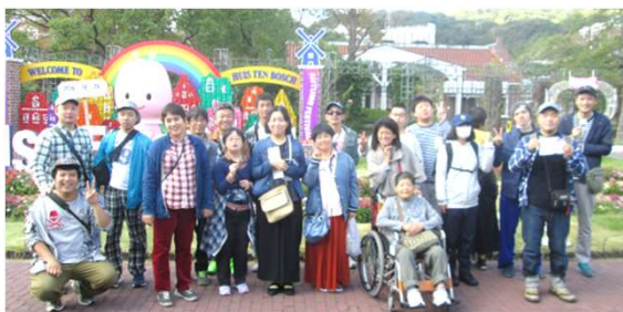
わいわい楽しい！みんなで出かけ♪ また小旅行も行きましょうね。