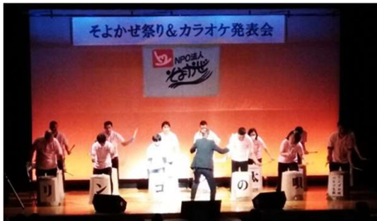
そよかせ祭りに参加するため、バケツ太鼓を猛練習！